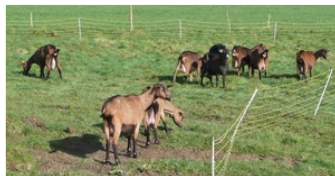
Chèvres en pâture

• La ferme de Marie-Claude est constituée de 11 ha de terre, principalement destinée au pâturage des chèvres. Une partie de cette terre est réservée au foin pour leur alimentation.