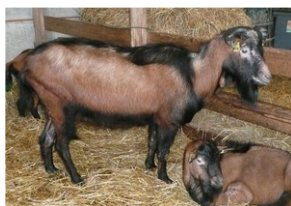
Les boucs du cheptel