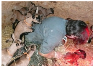
Séchage à la paille

Dans un premier temps Marie-Claude leur fait une toilette complète à l'eau puis direction la nurserie pour un séchage à la paille sous des lampes les maintenant à la bonne température. Pas de mixité à la chèvrerie. Dès la nurserie les femelles sont séparées des mâles et placées dans un enclos spécifique. Régulièrement Marie-Claude devra s'assurer qu'un petit malin, dont les testicules ne sont pas descendues, ne se soit infiltré dans le camp des femelles. Fait rare mais envisageable car déjà vu.